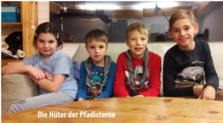
Die Hüter der Pfadisterne

Reporter: Wie reist ihr durch die Galaxie?